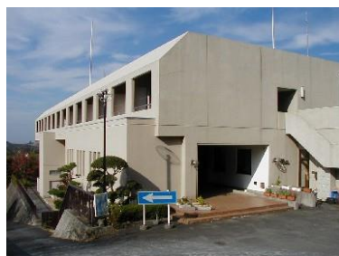
栃木県芳賀青年の家(宿泊)

雄大な大自然の中で、合宿及び集団生活を通して、心身の鍛錬や向上、自律心・社会性・協調性を育て、さまざまな体験をすることを目的と致します。合宿への参加ご希望の方は、「参加申込書」に必要事項をご記入の上、担当コーチまでお申し込み下さい。尚、 定員30名 になり次第締め切らせていただきますので、あらかじめご了承下さい。(※先着申込順とします) 尚、参加申込を受付された方には、後日詳しい資料をお渡しいたします。また、参加費用の納入につきましては、毎月のスクール月謝振替口座より期日(7/14)を指定してゆうちょ銀行の口座より自動払込にて納入していただきますので、予めご了承願います。