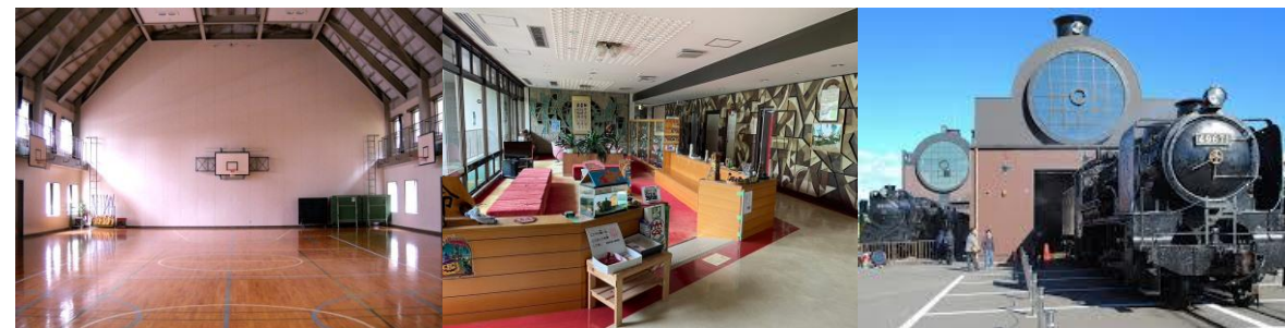
施設専用体育館(強化練習)